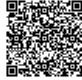
请扫描以查询验证条款